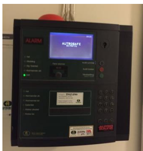
Brannsentral med nøkkel festet til skap.