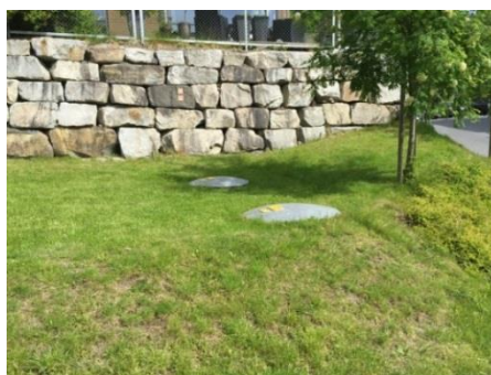
Gasstanker m/tankdom for fylling

Nøkkel til dom/fordamperhus har Brannvesenet og leder i sameiene: