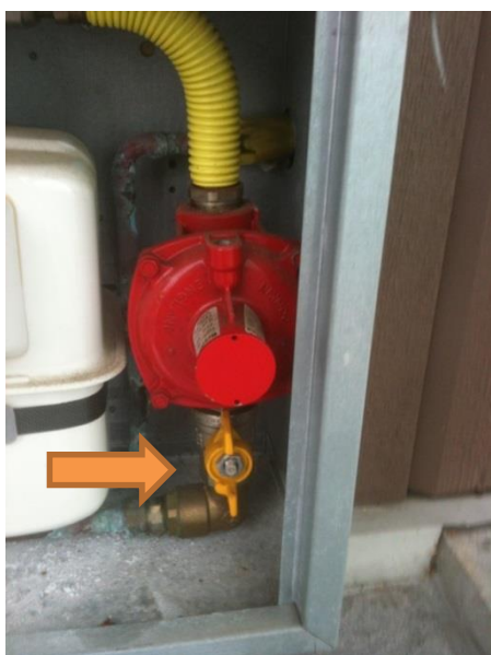
Åpen ventil (gul)

Vakttelefon 2: 98 25 00 13 – 91 89 66 92 – 91 57 01 02