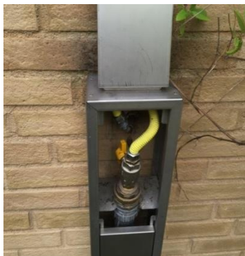
Stengeventil til hver etasjeseksjon