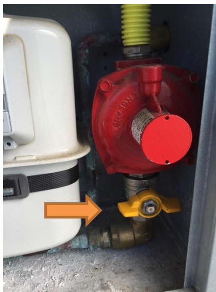
Stengt ventil (gul)

Telefonnummer til Alfa Olis bør henges opp på skap!!